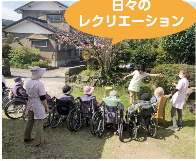
日々のレクリエーション